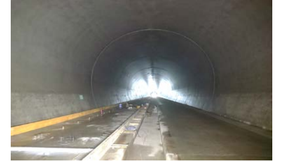
19.国縫トンネル他 坑内状況