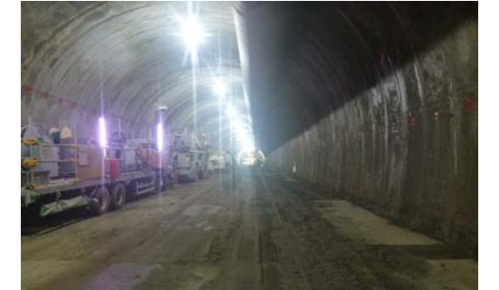
21.内浦トンネル(東川) 本坑状況