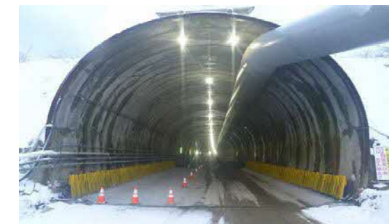
21.内浦トンネル(東川) 本坑状況