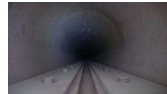
19.国縫トンネル他 坑内状況