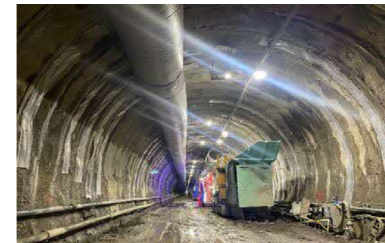
28.ニツ森トンネル(鹿子)他 覆工完了状況