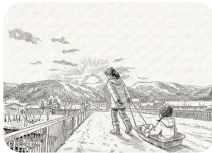
▲毎朝、娘をそりに乗せ登園しています。

11月に着任してから約3か月。窓の外の風景がすっかり雪景色に変わりました。 今月から、「プロマネノート」と題し、保育園留学の近況を町の皆様にご報告するコーナーを始めます。初回はご挨拶を兼ねて、この3か月で感じたことをお話しさせていただきます。