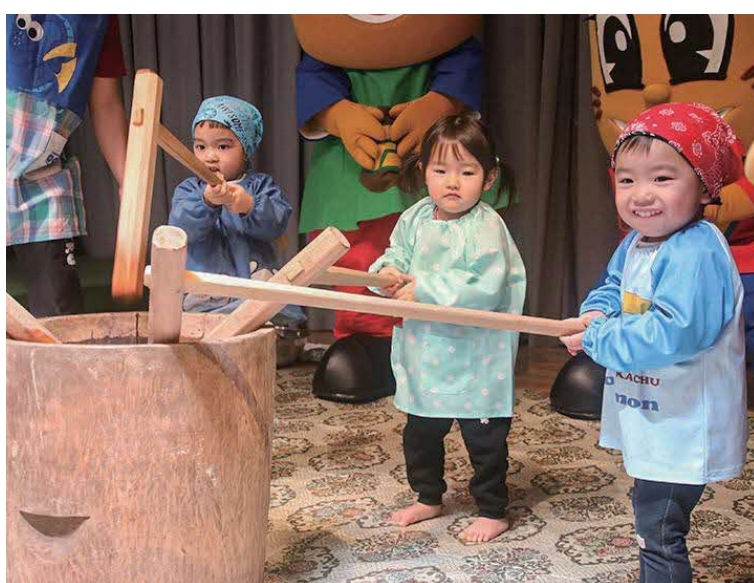
▲おいしいお餅になーれ！（ぺったんこ！ぺったんこ！）

1月23日(金)、認定こども園はぎで「おもちゃつき会」が行われました。おらにもファミリーが園児たちの餅つきを応援するために駆け付けました。先生たちのお手本を見た後に各クラス順番に餅つきを開始。みんなで美味しくなるように「ぺったんこ！ぺったんこ！」と言いながら一生懸命にお餅をつきました。つきたてのお餅は、ししまい組(年長児)が石臼で挽いたきな粉できな粉餅に。「おいしい！」と言いつつ、夢中でたくさん食べていました。