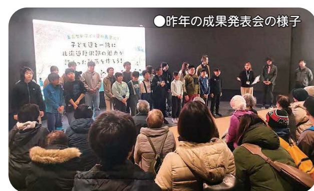
●昨年の成果発表会の様子

厚沢部町で始まった保育園留学は、今では全国へと広がっています。次回から、保育園留学の現場についてもお届けします。どうぞお楽しみに！