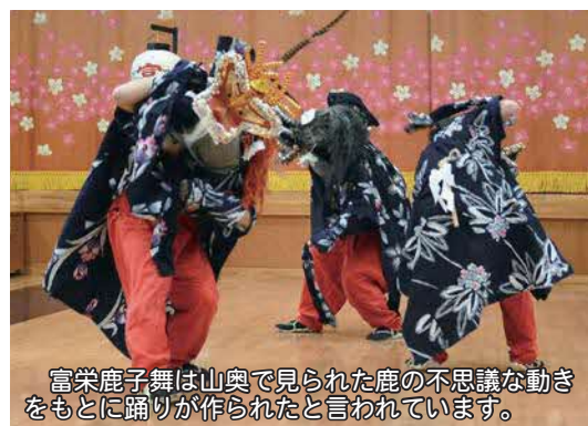
富栄鹿子舞は山奥で見られた鹿の不思議な動きをもとに踊りが作られたと言われています。

「鹿子舞はどのような目的で踊られるのか」と尋ねられることがあります。鹿子舞を踊る目的を知りたいという質問です。 実は、鹿子舞を踊る目的はよくわかっていません。一般的には五穀豊穡を祈願するなどと言われますがそれだけではないように思われます。 たとえば上里の鹿子舞は「陸奥国のある集落で起こった鹿子の祟りを鎮めるために行われるようになった」と伝