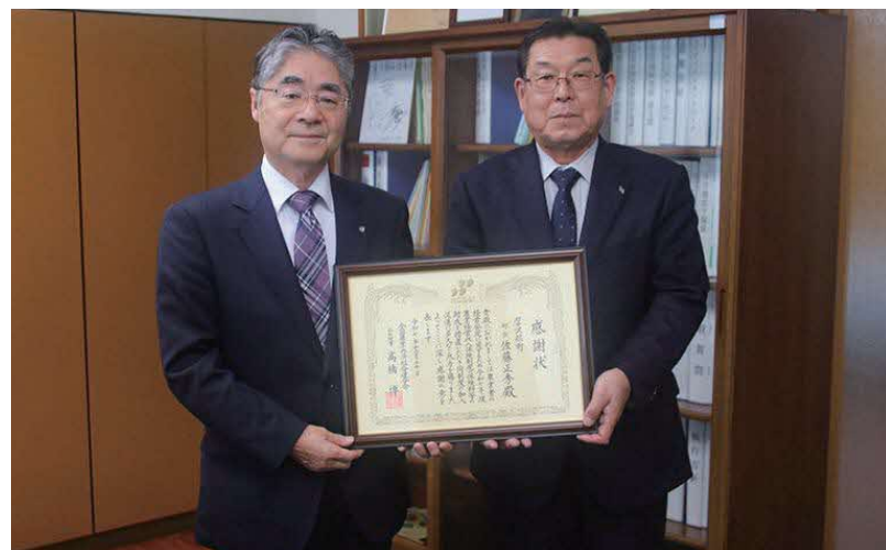
▲感謝状受賞後の町長と橋本統括理事(左)